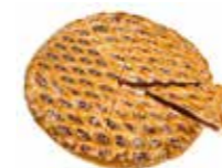
B179C10 | 5 x 1000 g KERSENTAART TARTE AUX CERISES