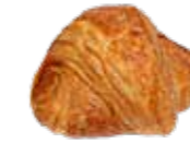
KB44 | 72 x 70 g BOTERKOEK COUQUE AU BEURRE