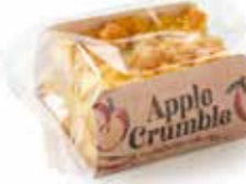
A307 | 100 x 50 g APPLE CRUMBLE CAKE