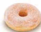
A32 | 72 x 49 g MyDOONY'S GESUIKERD MyDOONY'S SUCRÉ