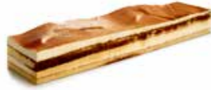
B173 | 6 x 700 g TIRAMISU