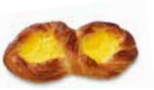
KB80 | 40 x 100 g ACHT MET CRÈME HUIT À LA CRÈME