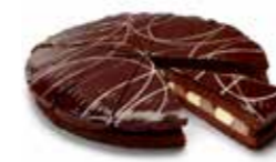
A240C12 | 4 x 1100 g DAY & NIGHT CHOCOLATE PIE