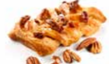
KB22 | 48 x 98 g MAPLE PECAN VOORGEGLAZUURD MAPLE PECAN PRÉGLACÉ