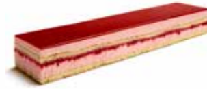
B178 | 6 x 700 g FRAMBOZEN BAVAROIS BAVAROIS AUX FRAMBOISES