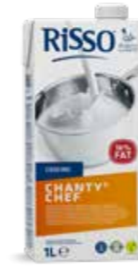
415918 | 12 x 1 L RISSO CHANTY® CHEF