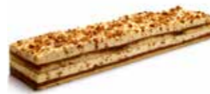
B298 | 6 x 700 g SPECULOOS BAVAROIS BAVAROIS AU SPÉCULOOS

TIP VERSNIJD DE STANG DIEPGEVROREN VOOR HET BESTE RESULTAAT