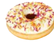
D11 | 36 x 58 g MyDOONY'S PARTY