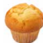
A28 | 40 x 82 g VANILLEMUFFIN MUFFIN À LA VANILLE