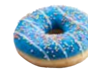
D192 | 36 x 55 g MyDOONY'S BLUE SKY