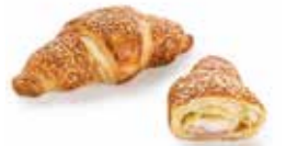
KB61 | 48 x 105 g HAM-KAAS CROISSANT CROISSANT JAMBON-FROMAGE