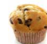
A77 | 40 x 82 g VANILLEMUFFIN MET CHOCOLADESTUKJES MUFFIN VANILLE AUX PÉPITES DE CHOCOLAT