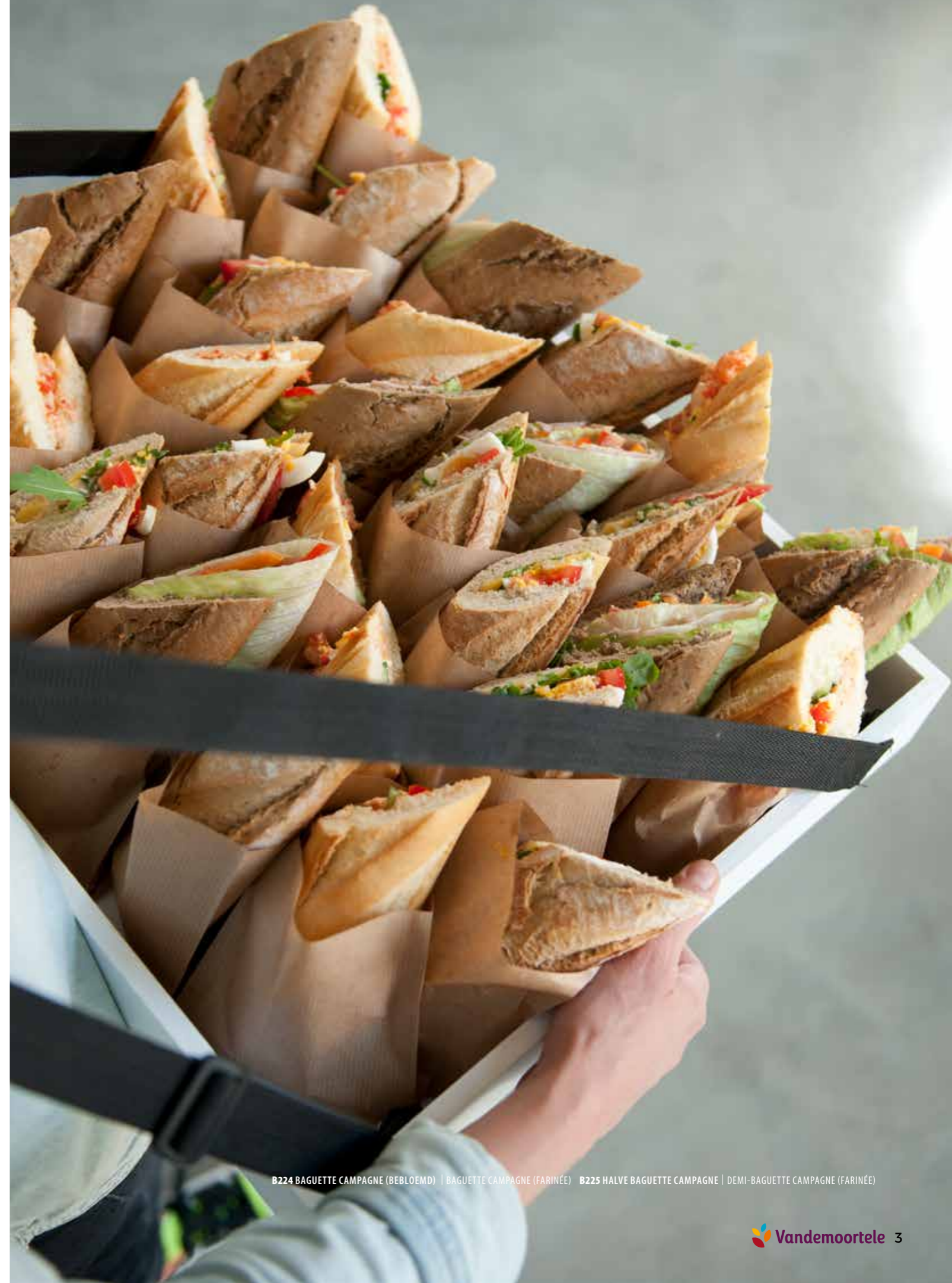
B224 BAGUETTE CAMPAGNE (BEBLOEMD) | BAGUETTE CAMPAGNE (FARINÉE) B225 HALVE BAGUETTE CAMPAGNE | DEMI-BAGUETTE CAMPAGNE (FARINÉE)

Découvrez (ici) notre gamme de produits végan