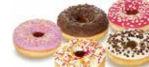
D5 | 60 x 58 g MyDOONY'S MIXED BOX