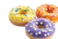
D197 | 90 x 22 g MyDOONY'S FRUITY BITES MINI