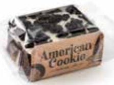
A308 | 100 x 50 g COOKIE CRUMBLE CAKE