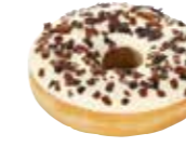
D77 | 36 x 58 g MyDOONY'S WHITE VANILLA