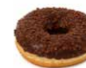
D80 | 36 x 55 g MyDOONY'S CHOCOLATE