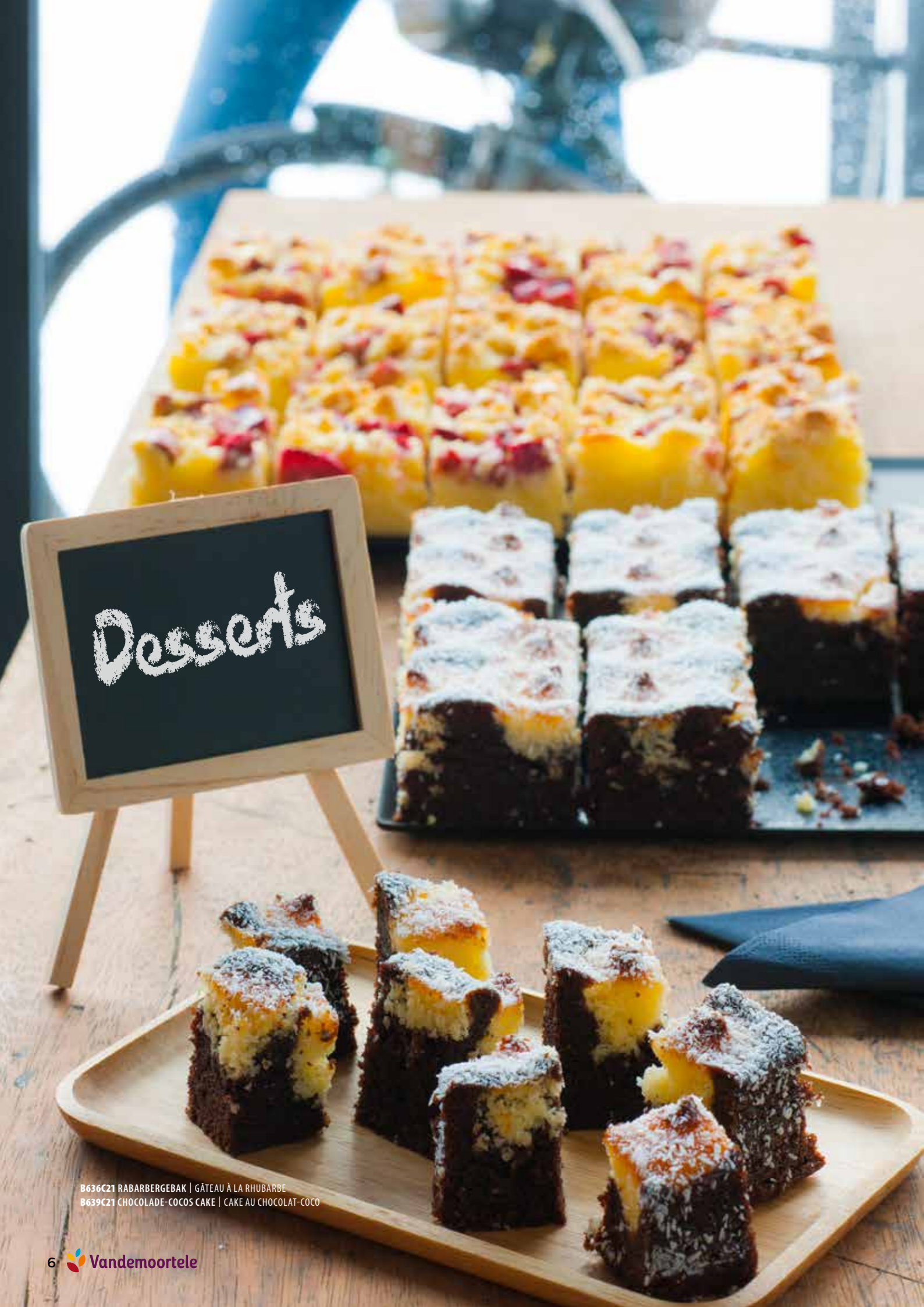
B636C21 RABARBERGEBAK | GÂTEAU À LA RHUBARBE B639C21 CHOCOLADE-COCOS CAKE | CAKE AU CHOCOLAT-COCO