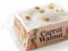
A306 | 100 x 50 g CARROT WALNUT CAKE