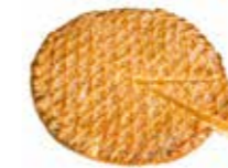
B180C10 | 5 x 1000 g ABRIKOZENTAART TARTE AUX ABRICOTS