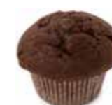
A29 | 40 x 82 g CHOCOLADEMUFFIN MUFFIN AU CHOCOLAT