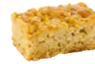
B717C21 | 3 x 2250 g APPELCAKE CAKE AUX POMMES