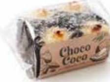
A309 | 100 x 60 g CHOCO COCO CAKE