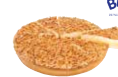
B761C10 | 4 x 1290 g BRESILIENNETAART TARTE BRÉSILIENNE