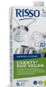
415642 | 12 x 1 L RISSO CHANTY® DUO VEGAN