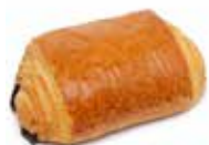
KB78 | 90 x 80 g BOTERCHOCOLADEBROODJE PAIN AU CHOCOLAT AU BEURRE