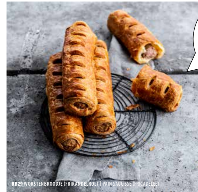
RB29 WORSTENBROODJE (FRIKANDELROL) | PAIN SAUCISSE (FRICADELLE)

Hartige vienoiserie Heerlijke aanvulling op je zoete assortiment