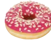
D85 | 36 x 58 g MyDOONY'S PINKY