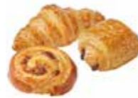
KB228 | 146 x 30-35-30 g MIXED BOX MINI-VIENNOISERIE(S) MET BOTER MIXED BOX MINI-VIENNOISERIE(S) AU BEURRE