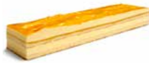
B177 | 6 x 700 g PASSIEVRUCHTEN BAVAROIS PASSION DES ÎLES