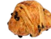
KB45 | 72 x 80 g BOTERKOEK MET ROZIJENEN COUQUE AU BEURRE AVEC RAISINS