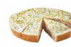
A304C12 | 4 x 1200 g BANANA CAKE