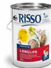
405961 | 1 x 10 L RISSO® LONGLIFE