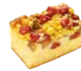
B636C21 | 3 x 2800 g RABARBERGEBAK GÂTEAU À LA RHUBARBE