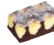
B639C21 | 3 x 2500 g CHOCOLADE-COCOS CAKE CAKE AU CHOCOLAT-COCO