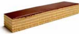
B170 | 6 x 800 g JAVANAIS