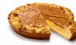
A238C12 | 4 x 1800 g HUNKY CHUNKY APPLE PIE