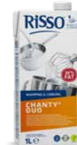
415921 | 12 x 1 L RISSO CHANTY® DUO