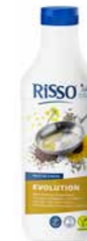
415653 | 9 x 900 ml RISSO® EVOLUTION

Bak en braad met gemak Cuire et rôtir en toute facilité