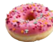
D190 | 36 x 54 g MyDOONY'S PINK CLOUD