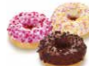
D134 | 90 x 22 g MyDOONY'S MINI MIXED BOX